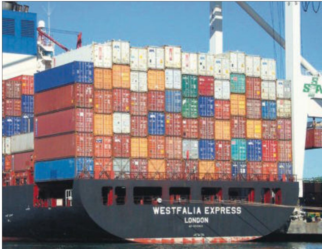
Los países desarrollados deslocalizan emisiones con la importación de bienes y servicios.

El crecimiento hay que apuntárselo tanto a los países desarrollados como a algunos en desarrollo. “El impacto de la crisis financiera de 2008-2009 en las emisiones globales ha sido breve debido