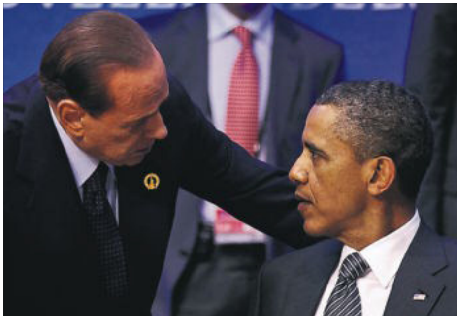
Berlusconi y Barack Obama, en mayo pasado en Deauville (Francia).

Resulta que lo que ha pasado es que, al adoptar el euro, España e Italia se han rebajado en la práctica a la categoría de países tercermundistas que tienen que solicitar préstamos en monedas de otros, con toda la pérdida de flexibilidad que ello conlleva. En particular, como los países de la eurozona no pue-