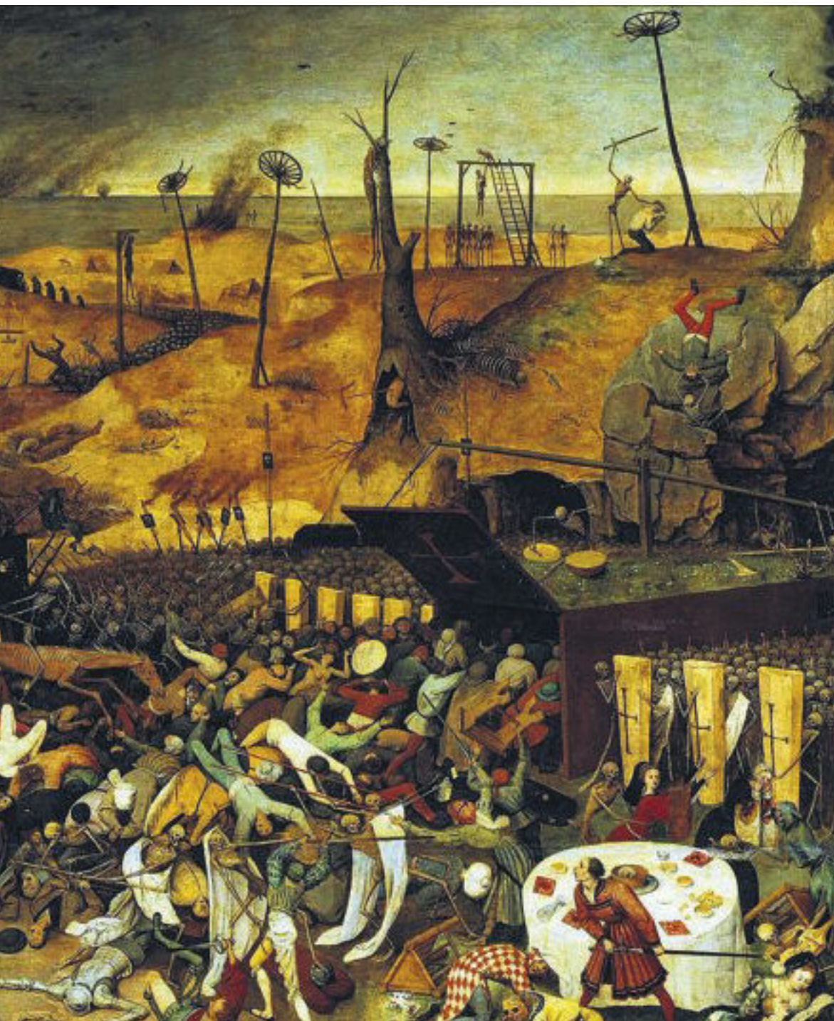
El triunfo de la muerte, obra de Pieter Bruegel el Viejo, expuesta en el Museo del Prado, refleja el clima de terror tras la Peste Negra.

do) y los inversores en la deuda son solo una de las manifestaciones de los grandes cambios económicos y sociales (pero también políticos, culturales e incluso religiosos, con el gran Cisma de Occidente) que tuvieron lugar en el siglo XIV y que los historiadores suelen englobar, extremando los tintes negativos, bajo la denominación general de “crisis del siglo XIV”, “crisis del feudalismo” e incluso “gran depresión bajomedieval”. Las otras manifestaciones son más conocidas, y por eso les dedico menos espacio en esta apretada síntesis.