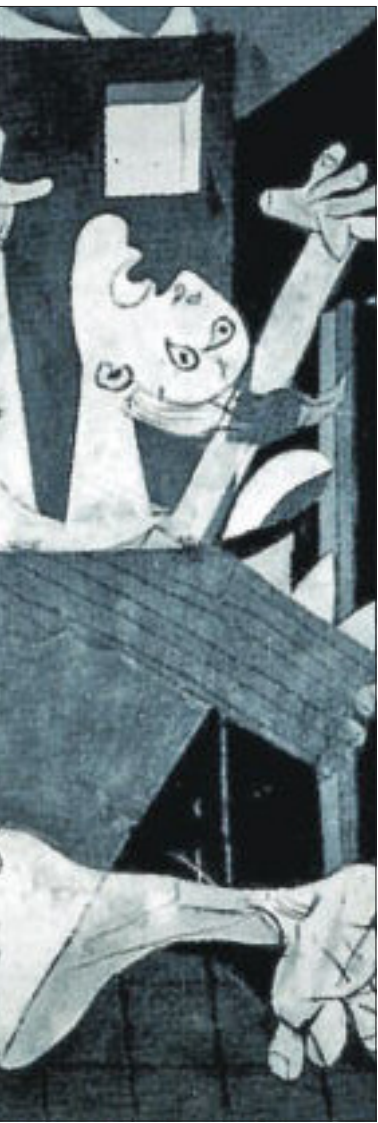
El Guernica de Picasso retrata uno de los peores episodios de la Guerra Civil.

de la inversión privada, originado por el empeoramiento de las expectativas empresariales, tras el establecimiento de la República, por los conflictos sociales, las políticas socializantes, el acoso a la propiedad por los Gobiernos, la desconfianza en el régimen y la paralización de las obras públicas. El hundimiento de la inversión privada fue clave en la depresión coyuntural de la economía española, pero la explicación de Olariaga requiere algunas matizaciones.