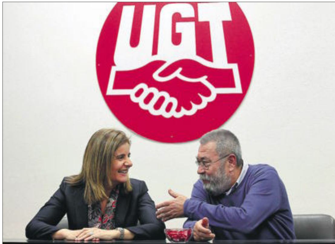
La ministra de Empleo, Fátima Báñez, y el líder de UGT, Cándido Méndez, en la sede del sindicato.

Frente a los puntos en común, los empresarios se han encontrado con la oposición de los trabajadores ante su propuesta de acordar un crecimiento salarial “extremadamente moderado”. Patronal y sindicatos trabajan en el acuerdo de negociación colectiva para extender la moderación salarial a 2013 y 2014; y barajan revisar el acuerdo para 2012, que establecía una subida de entre el 1,5% y el 2,5%.