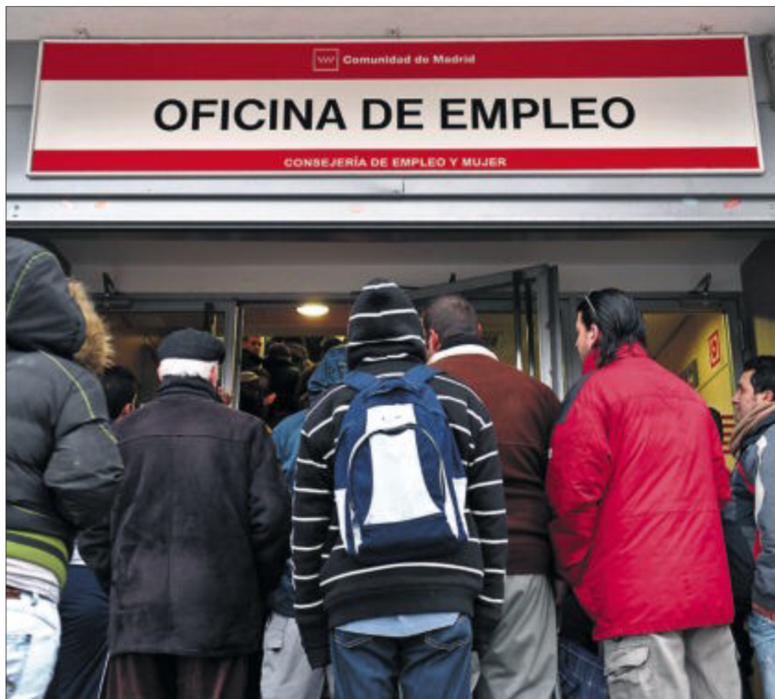
Parados hacen cola en una oficina de empleo de la Comunidad de Madrid.